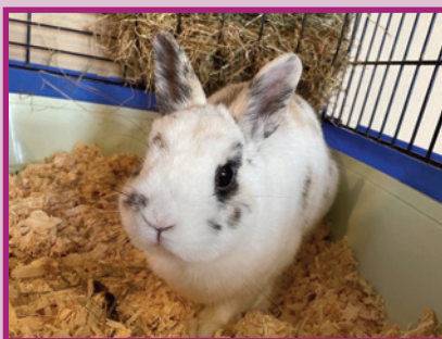
Lapinox • Mâle • 1 an

Vous cherchez un compagnon de vie pour stimuler vos journées, balades et passer des soirées en bonne compagnie ? Laissez-nous vous présenter Paco, une soif d'apprentissage ainsi qu'une vitalité physique et mentale.