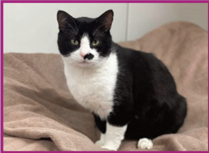
Georges • Mâle • 7 ans

Assez timide, Cody reste en retrait mais c'est un chat très gentil qui aura besoin d'un foyer où il pourra s'acclimater en douceur.