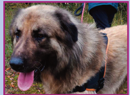
Rex Mâle • 3 ans ½

Plutôt calme, Oxanne apprécie les balades mais a une préférence tout de même pour les séances de câlins. Elle ne devra pas côtoyer d'autres animaux dans son futur foyer.