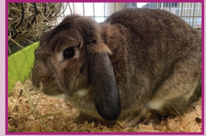
Eden • Femelle • 1 an

Un peu isolée à cause de ses mésententes avec les autres chats, cette minette n'en reste pas moins sociable avec l'humain. Un peu craintive au départ, Mirabelle s'épanouira dans un foyer calme avec un jardin. Elle reste joueuse et active.