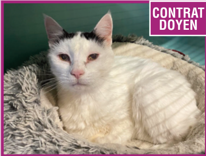
Câlin • Mâle • 10 ans

Eden est une lapine bélier calme et affectueuse. Elle rêve d'une maison chaleureuse où elle pourra se sentir en sécurité et choyée.