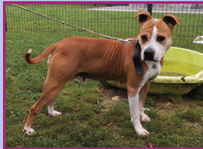
Tina • Femelle • 9 ans ½

Si vous recherchez un chat pot de colle, Elio sera le compagnon idéal ! Porteur du sida du chat, Elio va pour le moment très bien et n'a pas besoin de soin particulier.