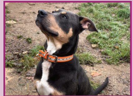
Atlas • Malinois • 2 ans

Lapinox est un lapin nain énergique et sociable. Il cherche une famille prête à lui offrir un foyer rempli de câlins et d'aventures.