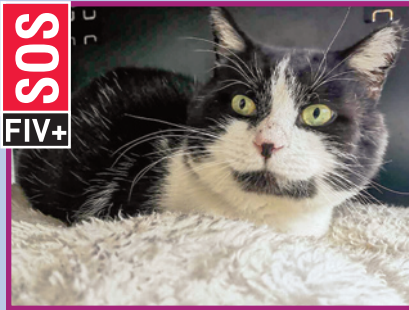
Elio • Mâle • 5 ans FIV+

Lio est arrivé au refuge à l'âge de 3 mois assez craintif. Malheureusement le contexte du refuge n'a pas aidé à sa sociabilisation. Mais nous espérons qu'il trouvera rapidement un nouveau foyer afin que le refuge ne soit pas la seule chose qu'il aura connu lors de sa première année de vie.