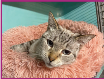
Sarabi • Femelle • 3 ans

Un très bon présage pour son caractère, Câlin est bien nommé ! Un peu plus vieux que la moyenne de nos chats, certes, mais tellement adorable. N'est-ce pas une belle action de le sortir du refuge pour qu'il passe un joyeux Noël ? L'adoption d'un doyen est différente de celle d'un chaton, mais n'oublions pas que nous prenons tous de l'âge.