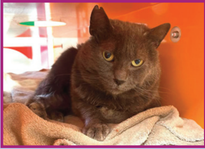
Cody • Mâle • 4 ans

Assez timide, Cody reste en retrait mais c'est un chat très gentil qui aura besoin d'un foyer où il pourra s'acclimater en douceur.