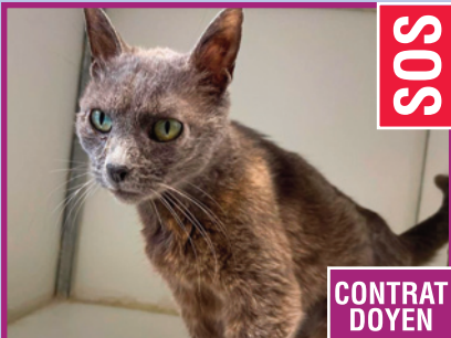
Teddy • Femelle • 10 ans

Georges est arrivé au refuge en étant très méfiant mais il s'est beaucoup détendu et se montre dorénavant très affectueux !