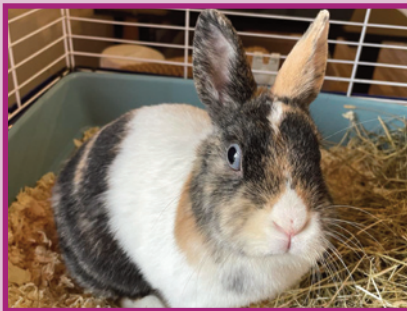
Cookie • Femelle • 2 ans

Transférée en urgence dans nos locaux, Galate faisait partie d'une colonie de chats vivant dans la malpropreté et la maladie. Bien qu'elle ait été remise sur pied, elle souffre désormais de problèmes rénaux. La malchance l'accaparera-t-elle jusqu'au bout ? Nous espérons qu'elle trouvera une famille pour passer la fin de sa vie dans les meilleures conditions possibles.