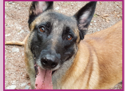
IRO • Malinois • 11 ans

Un brin dépressive depuis l'adoption de ses petits, Sarabi attend un foyer qui saura briser la monotonie de la vie au refuge. En demande d'affection, elle saura s'adapter à un foyer aimant et chaleureux.