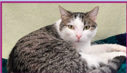
Leo • Mâle • ans

Teddy est arrivée de la fourrière et nous ne connaissons pas son passé. Malheureusement des examens ont révélé qu'elle souffre d'hyperthyroïdie. Elle aura besoin d'un traitement à vie. Mais étant un chat doyen, elle pourra bénéficier d'un contrat doyen de la part de 30 millions d'amis qui prend en charge jusqu'à 800 € de frais vétérinaires.