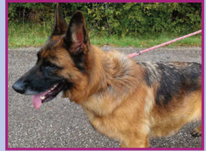
Roxy • Femelle • 4 ans

Tina est un chien de catégorie 1, il faudra effectuer les démarches administratives correspondantes.