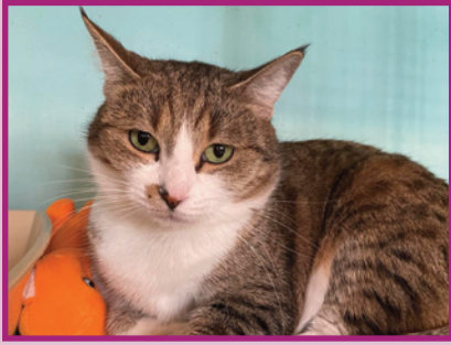
Peppa • Femelle • 5 ans

Guillerette, un peu grassouillette, Peppa est une petite femelle dynamique ! Elle peut se montrer méfiante si l'on est trop brusque avec elle, mais une fois en confiance, elle est pleine de joie et d'énergie.