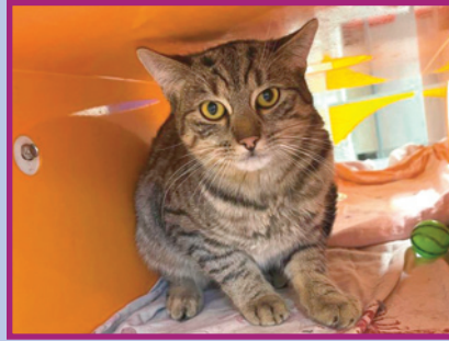
Lio • Mâle • 7 mois

Leo est un jeune chat assez réservé, mais quand arrive l'heure de la pâtée il montre son côté très affectueux et pot de colle ! Il aura besoin d'un petit temps d'adaptation avant de montrer sa vraie nature.