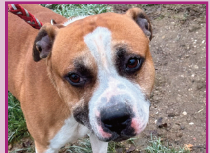
PACO • Staff • 6 ans

Cookie est une lapine nain pleine de douceur et de curiosité. Elle cherche une famille aimante qui saura lui offrir un espace pour s'épanouir et des moments de tendresse.