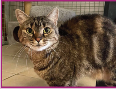
Mirabelle • Femelle • 8 ans

Guillerette, un peu grassouillette, Peppa est une petite femelle dynamique ! Elle peut se montrer méfiante si l'on est trop brusque avec elle, mais une fois en confiance, elle est pleine de joie et d'énergie.