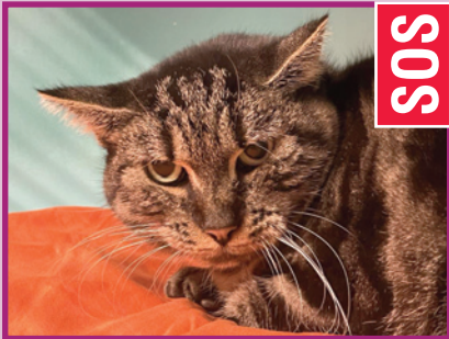
Galate • Femelle • 9 ans

Iro attend la personne qui lui offrira quelques douces années stables et paisibles, entouré d'amour, de patience et de compréhension. Laissez-lui une chance de vous surprendre !