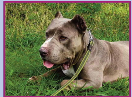
Oxanne • Femelle • 6 ans

Sam est arrivé au refuge suite à une saisie. Son ancienne vie n'a pas été toute rose. Il aura besoin de reprendre confiance en l'humain. Mais il se montre affectueux et apprécie les grandes promenades !